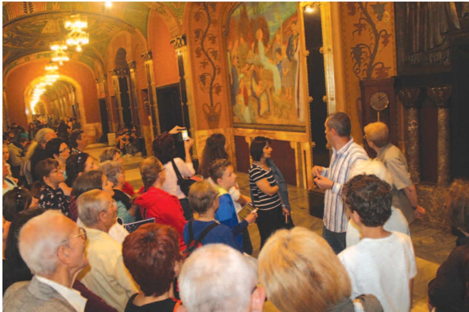
Idén új kiállítás lesz látható a Kultúrpalota előcsarnokában